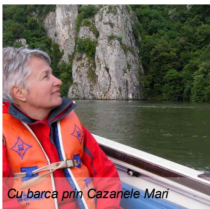
Cu barca prin Cazanele Mari