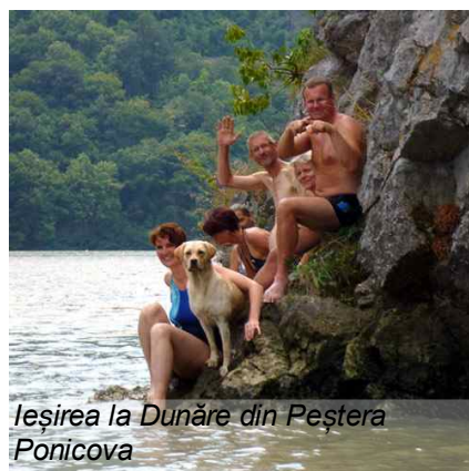
Ieșirea la Dunăre din Peștera Poniceva

SC Tymes Globetrotter SRL Str. Lisabona 7/1A, Timisoara 300603 T/F: +40256203015 @: info@tymestours.ro Contact: Cristian Badoiu, +40 722 525 734