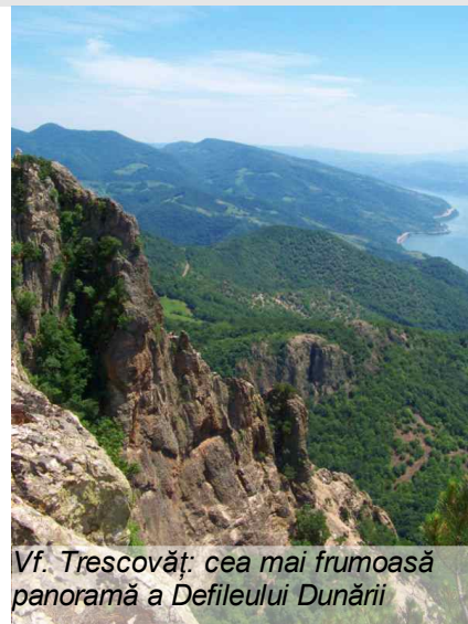
Vf. Trescovăț: cea mai frumoasă panoramă a Defileului Dunării