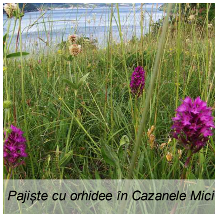
Pajiște cu orhidee în Cazanele Mici

Prețurile sunt diferențiate funcție de mărimea grupului, sezon, programul efectiv ales etc. Vă înmănam cu plăcere prețurile corespunzătoare separat, conform cerințelor Dumneavoastră concrete.