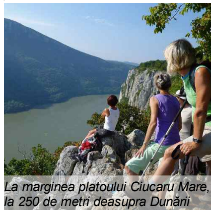
La marginea platoului Ciucaru Mare, la 250 de metri deasupra Dunării

Satul Dubova se află în zona cea mai spectaculoasă a defileului, între Cazanele Mari și Cazanele Mici. Recomandăm insistent o plimbare lejeră pe platoul Ciucaru Mare (cca 1.5 h); acesta se termină brusc cu un abrupt impresionant de 200-250 metri deasupra Dunării. De aici, vapoarele ce trec pe fluviu par mici jucării. Sub platoul Ciucarului se află