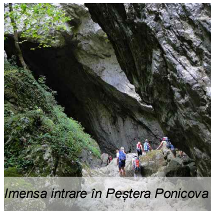
Imensa intrare în Peștera Poniceva