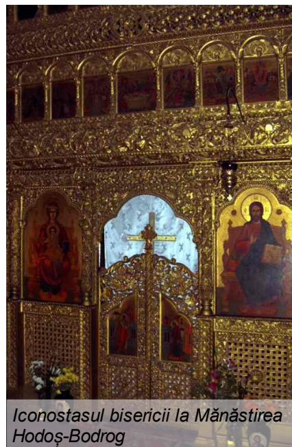
Iconostasul bisericii la Mănăstirea Hodoș-Bodrog