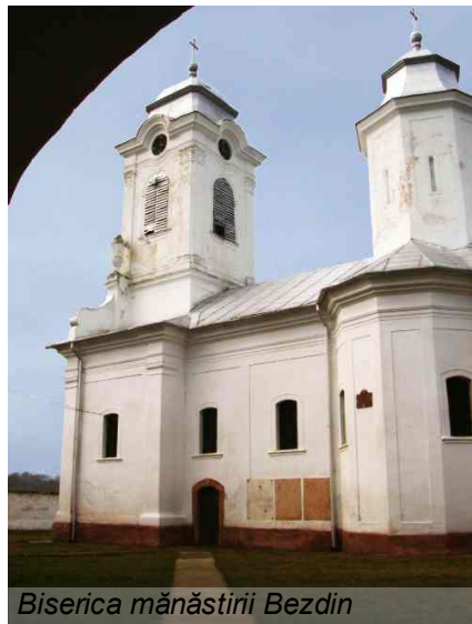
Biserica mănăstirii Bezdin